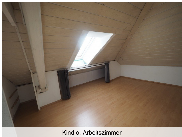
Kind o. Arbeitszimmer