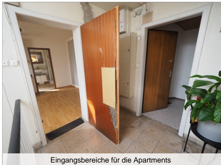
Eingangsbereiche für die Apartments