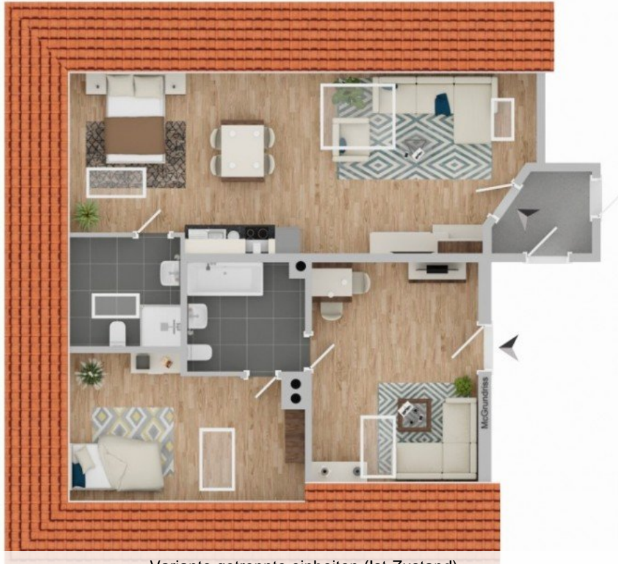
Variante getrennte einheiten (Ist-Zustand)