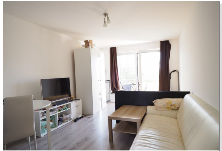
Wohn- / Schlafzimmer