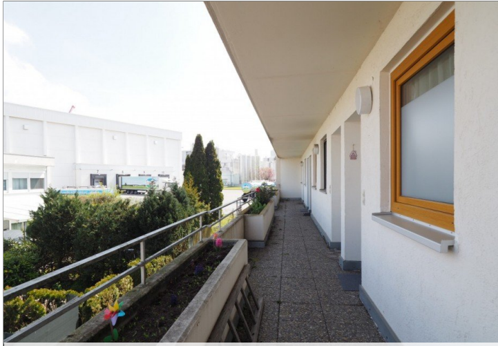
Laubengang / Wohnungseingang